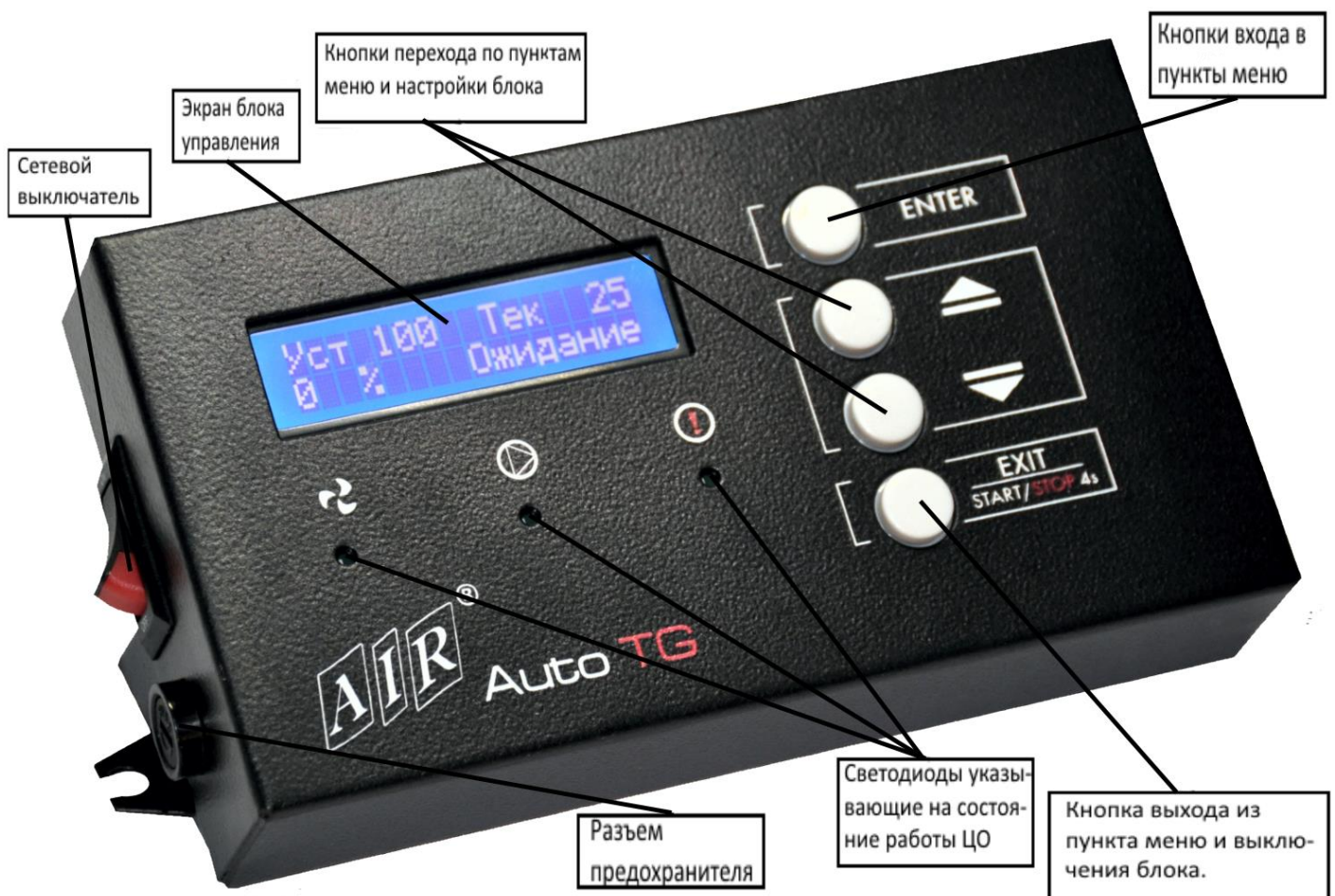
Рисунок 2 – Внешний вид контроллера

Экран блока управления – отображает режим работы котла. При входе в «МЕНЮ» отображаются пункты меню и режимы настройки соответствующих пунктов.