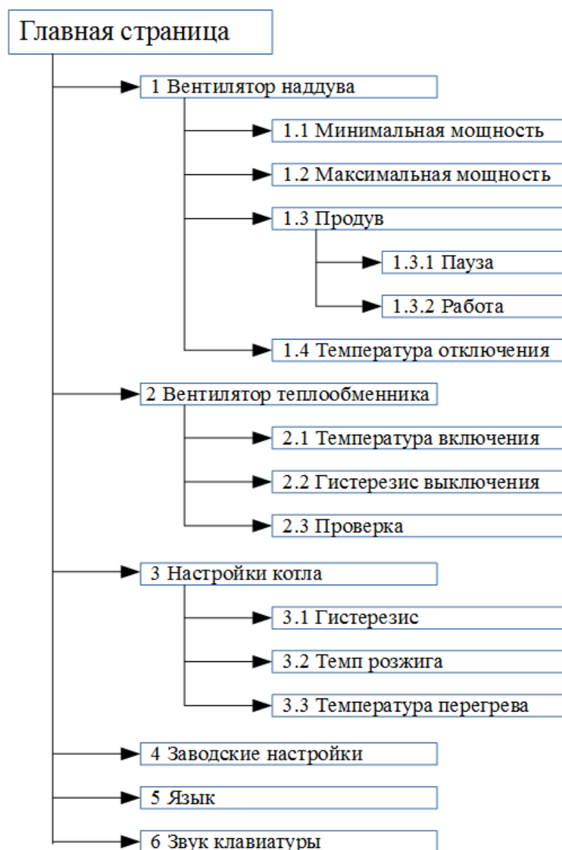
Рисунок 4 – Структура меню пользователя MPT AIR AUTO TG

Кнопка «ENTER» предназначена для входа в меню пользователя. Структура меню пользователя показана на рисунке 4.